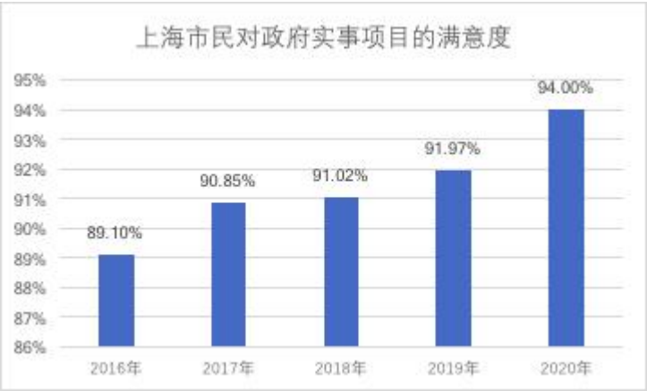
下图：上海市居民对政府实事项目满意度

（1）有网友告白：喜欢上海不需要理由。因为上海正在践行“人民城市人民建，人民城市为人民”理念，建设“美好社会生活共同体”。请结合材料，运用《国家政权人民当家》的知识分析说明该观点。