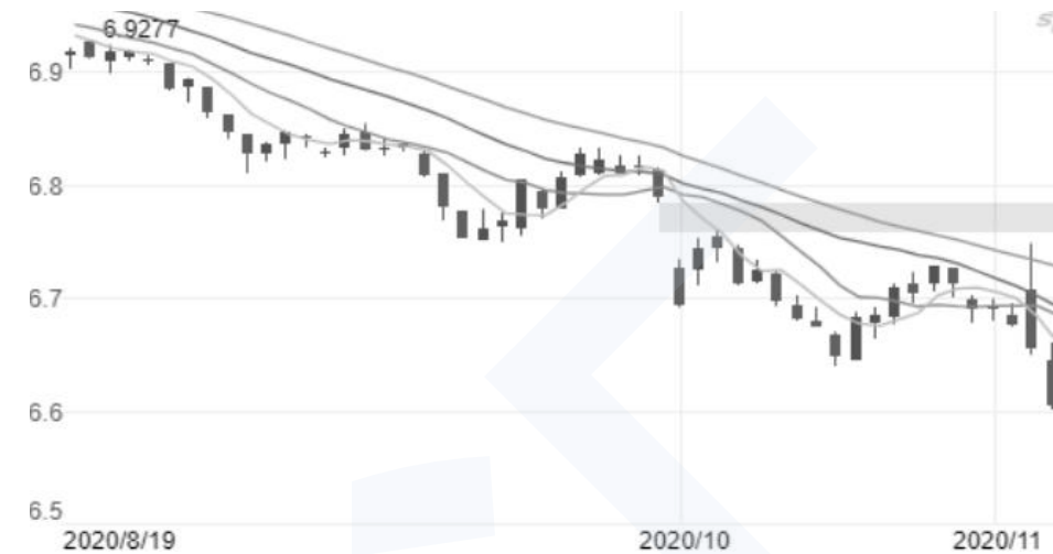
2020 年 8 月 19 日-11 月 18 日美元兑人民币汇率变动情况图（单位：元）

注：截止 2020 年 11 月 18 日上午 12:37，美元兑人民币汇率为 6.5525。