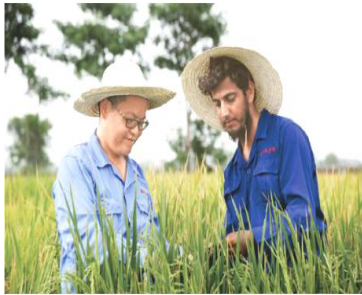
巴基斯坦东部旁遮普省首府拉合尔西南郊，来自中国的农业专家（左）同当地技术人员在稻田里进行杂交水稻选种试验。